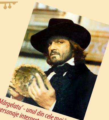
Mărgelatu' - unul din cele mai îndrăgite personaje interpretate de Florin Piersic

„Dacă ne luăm cu viața în altă parte, uităm să trăim”. Cu amintirea locurilor de altădată mereu vii în mintea sa, cu dragoste pentru tot ce însemna frumos și bine, artistul spune că se reîntoarce cu drag în urbea în care s-a născut, în primul rând pentru oamenii locului: Actorul afirmă că nu poate să uite străzile tăcute, pavate cu piatră cubică ale orașului, unde a învățat ce înseamnă să fii „Om” și să ai caracter.