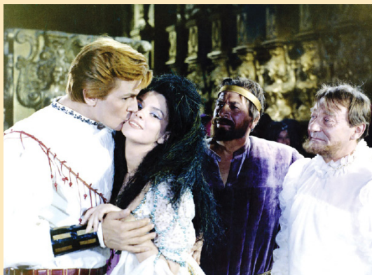
De-aș fi Harap-Alb

Cariera și rolurile interpretate de Florin Piersic îl plasează pe marele actor în top; la împlinirea vârstei de 75 de ani, fiind omagiat printr-o stea ce a fost amplasată în Piața Timpului din București, pe Aleea celebrităților românești.