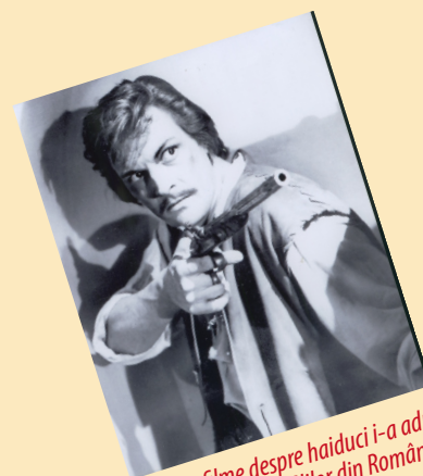
Seria cu filme despre haiduci i-a adus recunoștința cineaștilor din România

Din jale se întrupează Electra- Orin Dulcea pasăre a Tinereții- Chance Wayne Orfeu în infern- Val Xavier Mașina de scris- frații gemeni Pascal și Maxim Ascultă-ți inima- Sașa Ștabela nevăzută- Toma Moartea unui artist- Toma Iubesc pe al șaptelea- Ion Popescu Oameni și șoareci- Lennie Idiotul- prințul Lev Nicolaevici Miskin Apus de soare- Rareș Un fluture pe lampă- Tit Liviu Hentia Năpasta- Ion nebunul Danton- Camille Demoullins Richard al III-lea- Henric Vedere de pe pod- Rodolfo Șapte zile care au zguduit lumea- Smirnov A treia patetică- Valerik Săptămâna patimilor- Preotul A treia țeapa- Romanul Cartea lui Iovita- Iovita Gaițele- Mircea Aldea Coana Chirița - Leonas Zbor deasupra unui cuib de cuci- Indianul Bronden Moștenirea- Sigismund regale și împăratul Austro-Ungariei Eminescu și Veronica- Eminescu Corina – Ștefan Valeriu Logodnicele aterizează la Paris (Boeing, Boeing)- Bernard